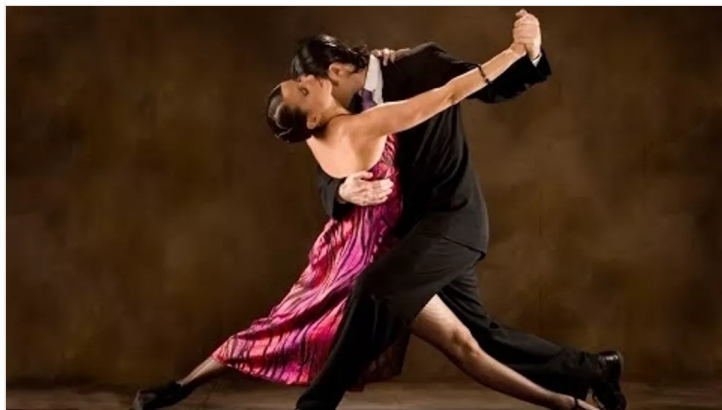
Carlos Gardel - Por Una Cabeza (tango)