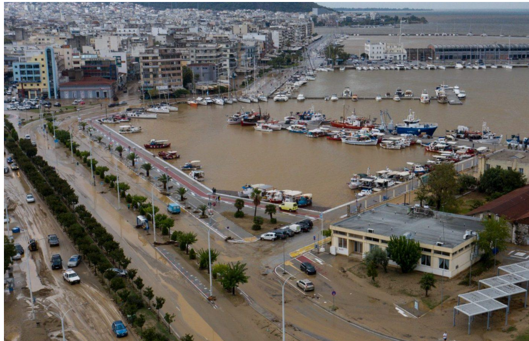
ΒΟΛΟΣ ΠΛΗΜΜΥΡΑ 2023