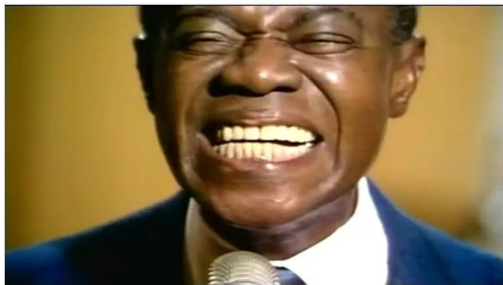
Louis Armstrong - What A Wonderful World από τον/την Soulful Sounds YOUTUBE